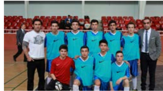
Okul Futsal Takımımız