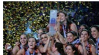
Eczacıbaşı Vitra, İtalyan rakibi Unendo