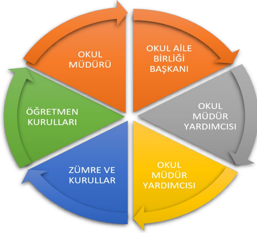
Şekil 3: Okul Paydaşları Şeması

Paydaş analizi sürecinde anket uygulaması, toplantı ve çalıştay sonuçları değerlendirilerek elde edilen görüş ve öneriler sorun alanları, kurum içi ve çevre analizleri, GZFT analizi ile geleceğe yönelim bölümünün hedef ve tedbirlerine yansıtılmıştır. Atatürk Mesleki ve Teknik Anadolu Lisesi ürün ve hizmetleri ile ilgisi olan, kurumu doğrudan ya da dolaylı, olumlu ya da olumsuz etkileyen kişi, kurum ve kuruluşlar tanımlanmıştır. Kurum içi paydaş kimliğini aynı okulumuzda çalışan ve öğrenciler kurum dışı paydaşlar veli ve işletmeler şeklinde belirlenmiştir. Paydaş memnuniyetine ilişkin veriler aşağıdaki tablolarda sunulmuştur.